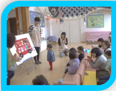
お弁当バスのパネルシアター楽しいね♪