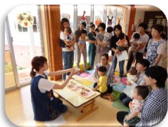
1、2歳児の給食 紹介がありました