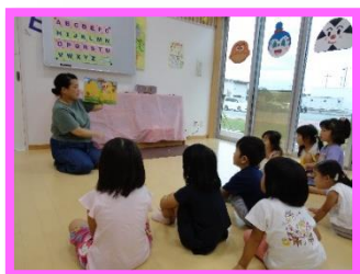
英語の絵本の読み聞かせ みんな集中しています