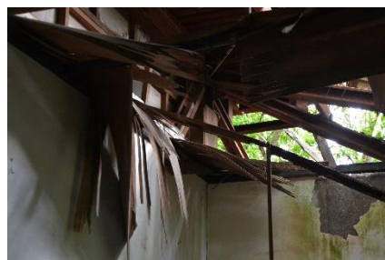
危険な空き家の様子(イメージ)