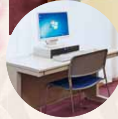
インターネットコーナー (ロビー) ご旅行、お仕事の情報検索にお役立ていただけます。