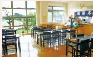
レストラン湯楽亭