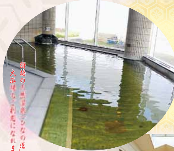
隣接の「無煙露天の湯」 大浴場もご利用いただけます