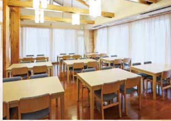
研修室 (レストラン) /34席