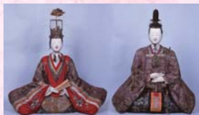
④享保内裏雛(紅花資料館) 町指定文化財 当地に伝わる華やかな雛人形の一つです。本品は座高86.5センチと大ぶりです。顔の胡粉磨きや眉目の描きぶりが美に見事です。紅花で栄えた商家と上方との結び付きを示す資料としても、高い価値があります。

月三十日(土)・三十一日(日)に開催されます。その中には平成三十年五月二十四日に日本遺産に認定されたものも展示されています。かつての紅花貿易がもたらした上方文化に触れることで、今でもその豪華さと現存する数の多さにより、谷地ひなまつりを訪れる人々を魅了し続けています。