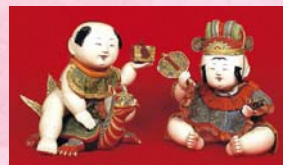
②御所人形(細谷昌平家) 町指定文化財 三頭身の白肉人形で、御所や公家より拝領されたところから御所人形と称しています。この人形は「天下取り」と「浦島太郎」を見立てており、とても立派な御所人形です。

最上紅花と呼ばれた当時の紅花は米の百倍・金の十倍といわれるほど高価でした。この紅花交易により町へもたらされた華麗な雛人形は、月遅れのひなまつりである四月に旧商家の方々の自宅や蔵に展示され、谷地ひなまつりとして一般公開されてきました。今年も近くの日開催ということで、三