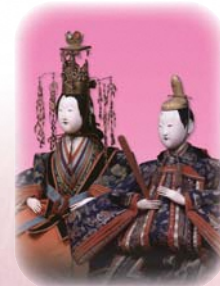
享保雛(紅花資料館)

り人形、からくり人形、竹田人形、御所人形、雛道具など数え切れません。谷地では内裏雛を京都風に飾っています。天子南面して東方が上位であるから、向って右に男雛を飾ります。京都から直移入した飾りを胸に京風にこだわった飾りとなっています。