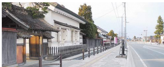
「日本の道百選」ひな市通り