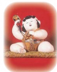
御所人形(紅花資料館)

当地に雛人形が多いのは、紅染めを見たいというふるさとの人の願いに紅花商人が応えたからと思われまます。当時紅染めを見せるために、紅の袴を着た雛を買ってきたのでしょう。また、日本一豪華で大きな雛が並びます。布の染方や織方が衣装の仕立の技法が向上してくると、小さな雛では表現できなくなりまます。衣装の全貌を明らかにし、財力と格式を誇示するために、有力商人は競って豪華な雛を購入したと考えられています。