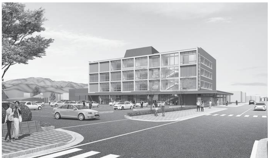
河北町役場新庁舎イメージ図

質 河北病院は紹介状を持参しないと、初診料が高くなるのか。 答 個人医院と同じで高くならない。