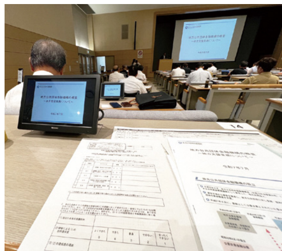
全国から多くの地方議員が参加