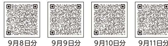
9月8日分 9月9日分 9月10日分 9月11日分

総務費 庁舎建物内の経費や人事、企画、財政、徴税、戸籍、選挙、統計など町の統括的な事務事業に使うお金