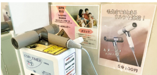
最近導入された女性に優しいヘアドライヤー

ひなの湯の ヘアドライヤー充実を 問 ひなの湯の源泉の修繕に関連してだが、脱衣所のヘアドライヤーは、もっと使いやすいように充実すべきではなかったか。 商工観光課長 いろいろなニーズに応えられるように検討したい。