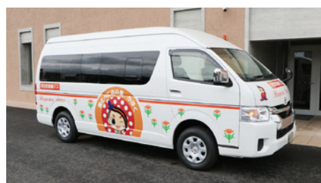
地域公共交通の充実を

問 地域公共交通の課題と再構築は。 生活環境企画主幹 協議会 では大学の先生、専門家、アドバイザーなどに意見をいただき、現状把握や先進地の視察をしているが、ドライバー不足の課題が出てきた。