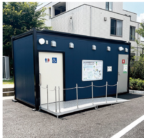
江戸川区に設置してある自己完結型水洗トイレ

東京都江戸川区に設置してあるこのトイレは1つのコンテナの中にトイレ個室と浄化槽システムやソーラーパネルを備えており、上下水道との接続や電力の引込を行うことなく利用できます。