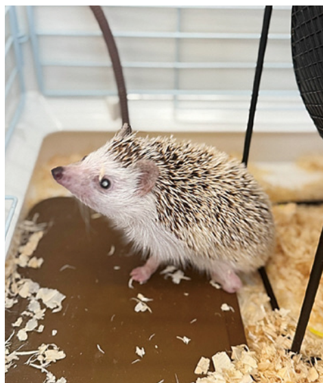
動物園と谷地高の連携で 受験者からの注目を

から、令和5年度と比較、約2・7倍に来園者が増加している。経済活性化も効果があると捉えており、更なる研究、検討を行う。