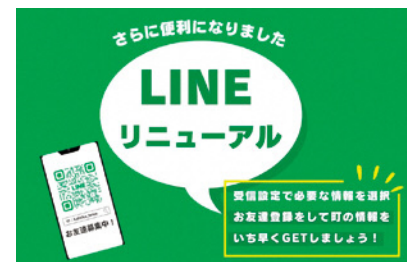
LINEリニューアル

町職員の省庁派遣 その仕事と目的は 問 町職員が省庁へ派遣されているが、仕事内容とその目的はどういうものか。 町長 人口減少問題と、いかに魅力的なまちづくりを進めるかなど、全国から情報が集まる総元締め省庁に派遣している。 職員には、情報を町に持ち帰り、また経験 を積んでもらう。