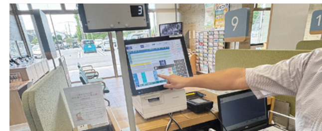
導入された公金収納レジ

役場にAI導入へ 個人情報扱わない 問 役場のDX（デジタル化推進）で、生成AIを試しに使ったようだが、有効性はどうだったか。 企画財政課長 資料作成や議事録づくりに使ってみたが、町民の利用方針はどうしているか。 生成AIは、生成AIを試しに使ったようだが、有効性はどうだったか。 今年の6月から導入している。 利用方針としては、個人情報扱わないこととしている。