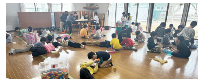
谷地中部小学区のちびっこ放課後学童クラブ

谷地中部小学区に もう一つ学童クラブは 問 学童クラブは、谷地中部小学区に1か所増やした。 それでも谷地中部小学区は、子どもの人数比で他の半分くらいだ。施設のほか指導員も必要で、町として対応が必要ではないか。 学校教育課長 今のままで良いと考えている。