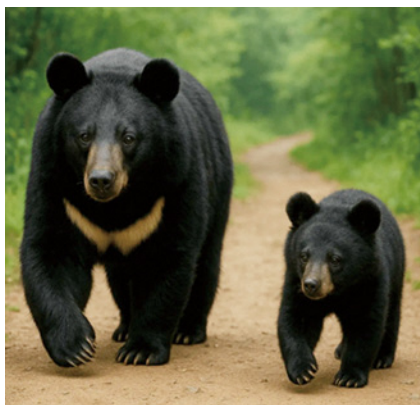
クマの習性を把握して 住宅地侵入対策を