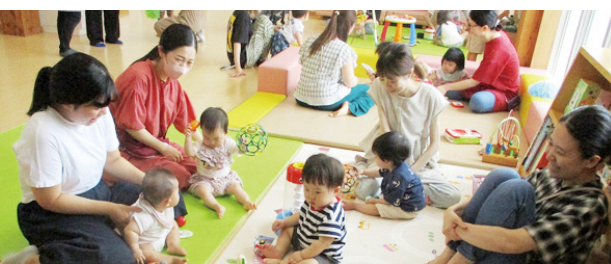
よく利用されている子育て支援センター

遊休農地の解消へ新たな耕作者の紹介 問 農地パトロールの効果はどうか。 農林振興課長 農業委員の方々を中心に取り組み、連絡して改善を求め遊休農地が解消される例もあるが、残念ながら増えている。町外の地権者が多く、耕作者の紹介などもするが、相続放棄の農地