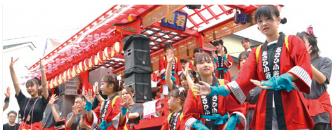
2025どんが祭り(燃える旭若) 若者定着の町づくりを