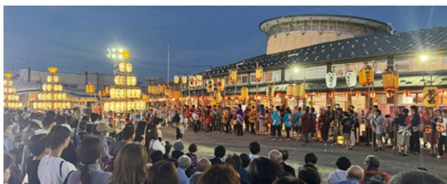
24時間外トイレが使えるようにしてほしい

どんがホール外トイレ 使えるよう検討 問 どんがホールの北、バス停の所にある外トイレは、時間により閉鎖があり、使いにくい。町の真ん中にあるトイレだ。どんがホールの指定管理者まかせにせず、町として対策をすべきではないか。 商工観光課長 このトイレは、タバコ火の始末など、いたずらが頻発した。どんがホールが開いている時間だけ使えるようにしている。使えるように検討したい。