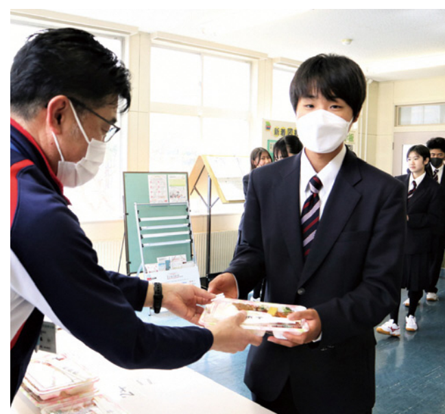
谷地高で昼食支援の楽弁

谷地高の楽弁支援もつと充実を 問 谷地高生に弁当を安く提供する楽弁支援は、谷地高生からどんな評価か。 学校教育課長 楽弁支