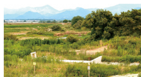
柏川と管理道路の交点に設置されたゲート

国土交通省が実施している築堤工事は、令和9年度に完了予定だが、令和8年度には、ある程度、築堤の形はできているとのことなので、それに間に合うように計画している。 現状では考えていないが、調査結果次第では、国と協議させてもらう。