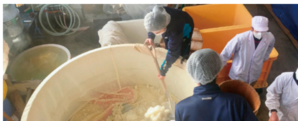
探求実践プロジェクトで酒づくり(谷地高ニュースより)