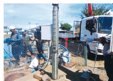
現状の源泉の調査作業

いちはやくひなの湯の新たな源泉掘削を 問 べに花温泉ひなの湯の新たな源泉の掘削場所は。 商工観光課長 ひなの湯付近の5か所を調査した結果、いずれの場所も湯量、泉質とも十分な基準という結果とということから、ひなの湯の敷地内で決定。 掘削の許可申請をして令和7年度中に許可が下りれば、令和8年度にも着工に入りたい。掘削方法には、複数の工法があり、どの工法を選択するかによって、完成までの工期が異なるので、今後、検討していく。