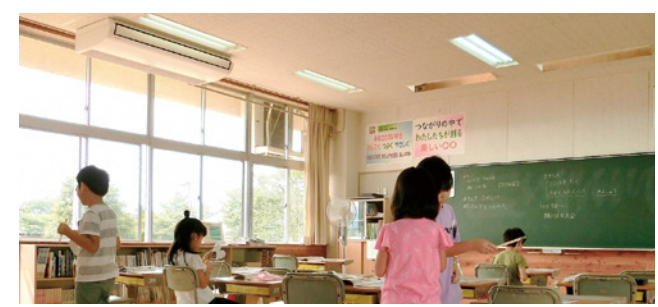
すべての教室にエアコンが設置されています

学校のゼロカーボン エアコン優先の暖房を 問 小学校と中学校は、全教室にエアコンが入っている。 暖房についても、エアコンを優先して使用したか。 エアコン暖房は熱効率が良いので、燃料を燃やす暖房より、ゼロカーボンに近づくので