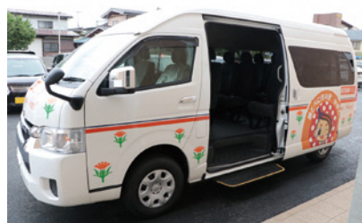
乗降ステップがつく町営路線バス

生活環境企画主幹 更新する予定の町営路線バスは、ジャンボタクシーと同じ仕様で、運転手を除き、9名が乗車可能。 ドアの開閉時に、ドアの下部にステップが稼働し、乗降車が楽になる。 令和7年度内に購入し、べにのすけなどのラッピングの準備をして、令和8年4月から