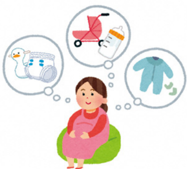
健康な妊娠出産のために

正しい知識や習慣を身に付け、妊娠前にリスクを減らすことが健康やかな妊娠出産や赤ちゃんの健康に繋がることからプレコンセプションケアは重要と思うが。