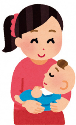
産後ケアの充実を

4月から7月までの執行額と予算分での予算額の50%となり、産後ケア事業への需要が高まってきている。