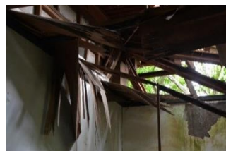
危険な空き家の様子(イメージ)