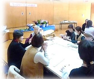
ファミリー・サポート講座