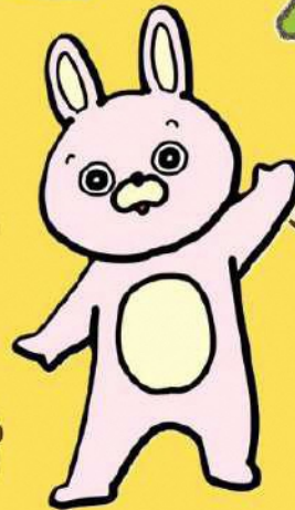
朝日町 イメージキャラクター 桃色ウサビ