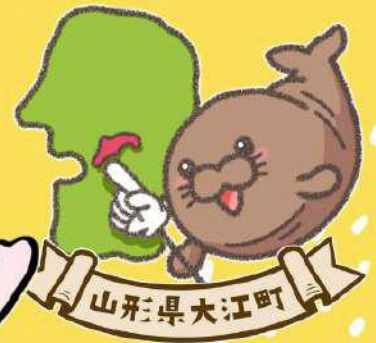
大江町 イメージキャラクター ぶくちゃん