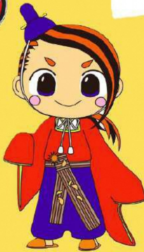
河北町 イメージキャラクター へにのまけ