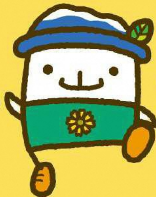
西川町 イメージキャラクター ガッさん