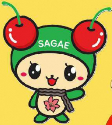
寒河江市 イメージキャラクター チェリン