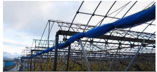
防鳥ネットは外すかまとめる