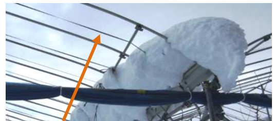
マイカ線を張ったままの施設はこまめに雪を下ろす(着雪防止)